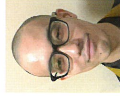
茅原 玄道 (Tihara Gendou) 栄徳寺 新潟県新潟市 [篆刻]