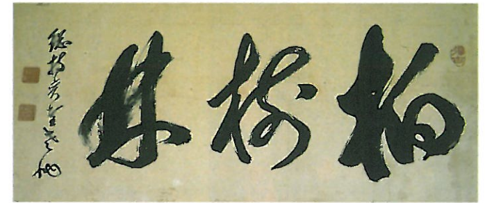
柏樹林 總持奕堂老衲